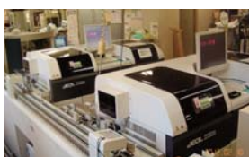
B. BM-6070(生化学自動分析器) BM-6070 2台を並列的に配置し、多数の検体を効率よく処理していきます。