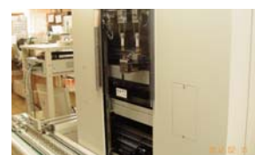
C. IDS-880ストックヤード サンプリングの終了した検体を順番通りに収納します。また、再検指示の出た検体を自動的に搬送ラインに戻します。