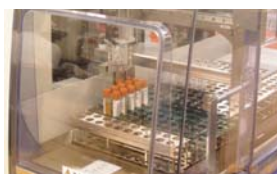
A. IDS-3000検体搬入部 遠心分離後の検体をセットするところです。